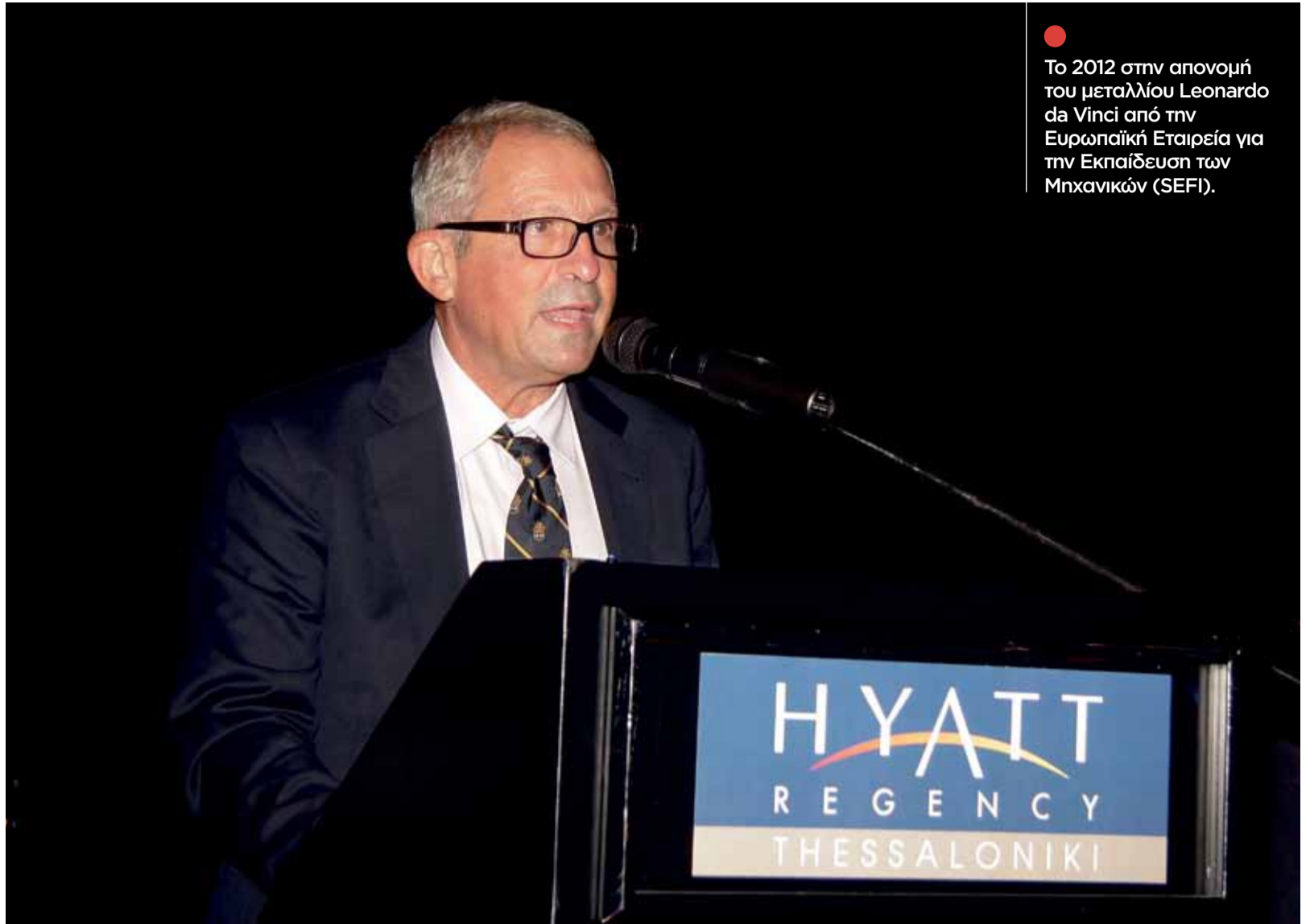
● Το 2012 στην απονομή του μεταλλίου Leonardo da Vinci από την Ευρωπαϊκή Εταιρεία για την Εκπαίδευση των Μηχανικών (SEFI).

Η συγγραφή του βιβλίου «Κατανοώντας και αλλάζοντας στον κόσμο» ολοκλη-