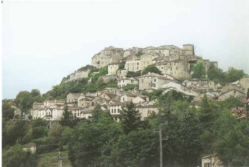
Η μοναδική Κορινθ

Ο επιβλητικός Ναός της Κορινθ από την πλατεία όπου εκτελέστηκαν οι Ιεροεξεταστές