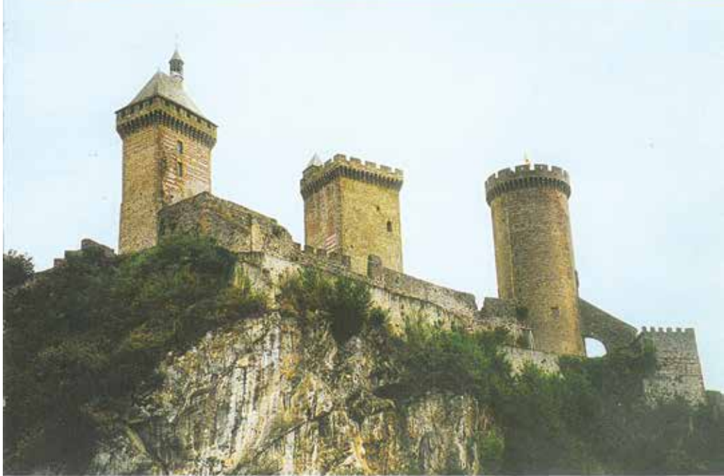
Το κάστρο του Φουά