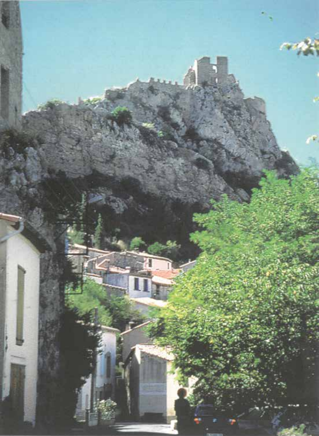
Το κάστρο της Τερμ