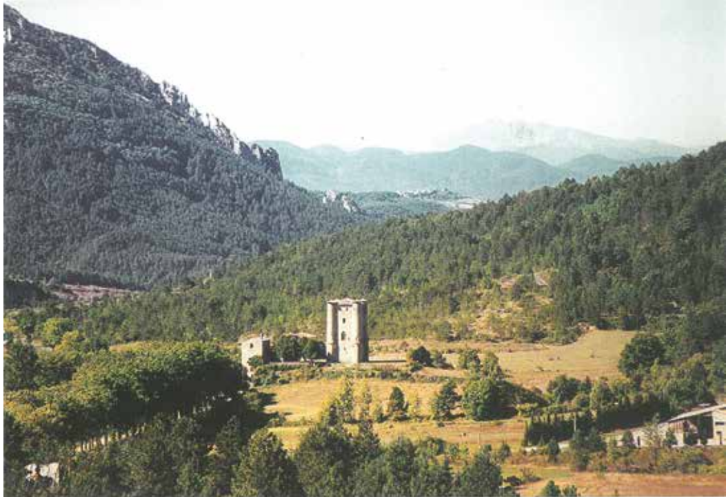
Ο πύργος της Αρκ και στο βάθος, ψηλά στο βουνό, το Ρεν Λε Σατώ