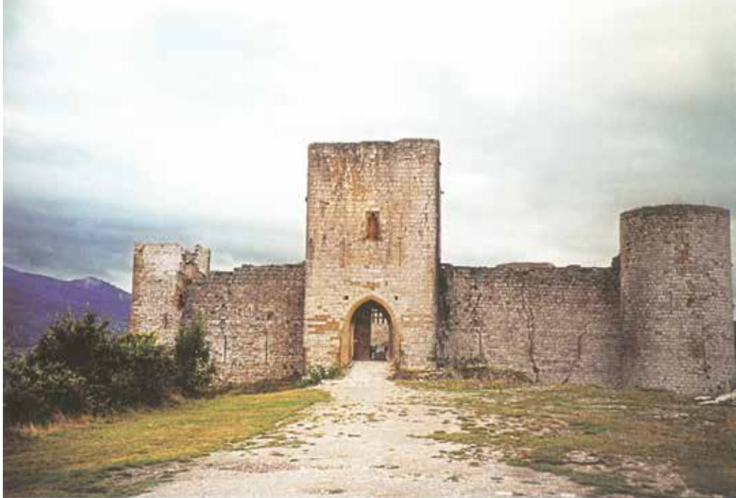
Το κάστρο του Πονιβέζ