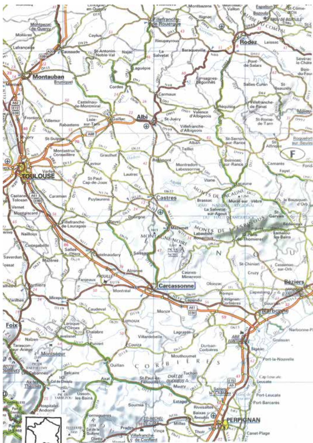
Χάρτης του Λαγκυεδόκ