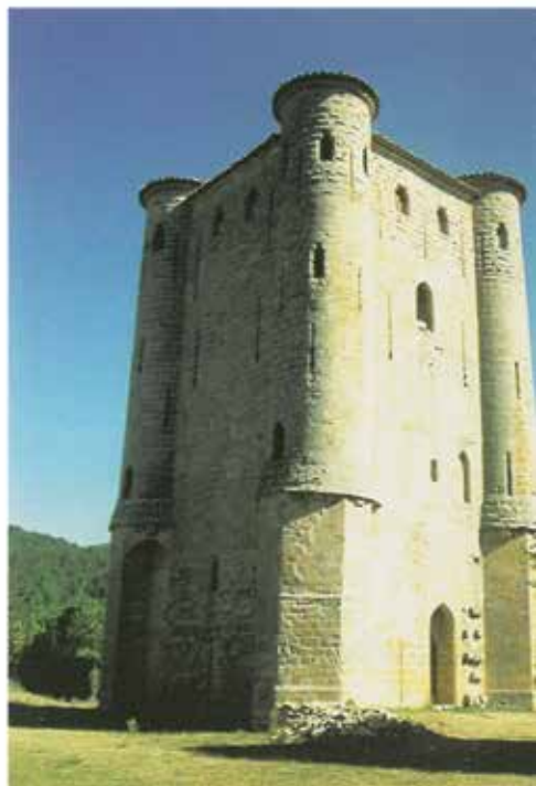
Ο επιβλητικός Ναός-οχυρό στο Μοντρεάλ