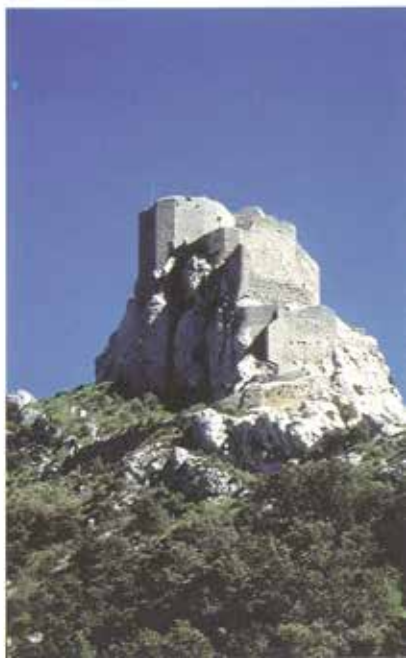
Ο πυργίσκος της «Magdala» στο Ρεν Λε Σατώ