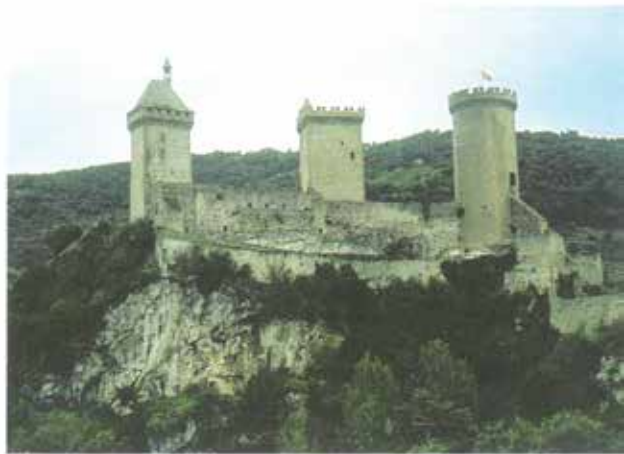
Άλλη άποψη του Φουά